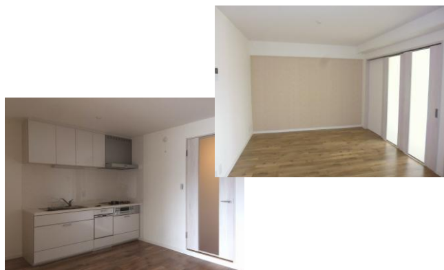
※図面と現況が異なる場合、現況を優先とさせていただきます。

【平成29年3月 リノベーション済】 キッチン、浴室、洗面化粧台、トイレ、建具 フローリング、スイッチプレート、洗濯防水パン 下駄箱、インターホン、TV配線、塗装などなど 全て新品に交換しました！